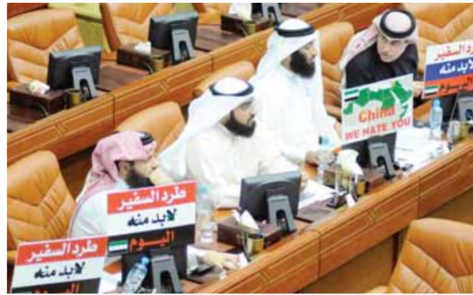
اللقاءات رفعتها النواب للمطالبة بطرد السفير السوري.