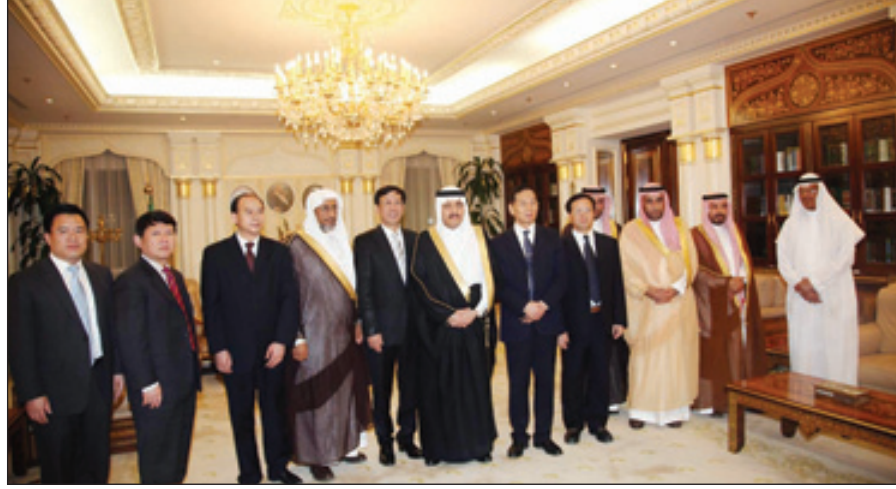
الأمير أحمد مستقبلاً النائب العام الصيني

وقال معاليه ان اهتمام الأمانة يأتي من خلال حرص ومتابعة صاحب السمو الملكي أمير منطقة مكة المكرمة وتوجيهاته الدائمة ل كل ما يسهم في تطوير مرافق هذه المدينة المقدسة ،