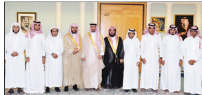
الأمير جلوي مع د. العقيل وأعضاء النادي الوطني بكنية الشريعة

الدمام - عوض الملكي استقبل صاحب السمو الأمير جلوي بن عبدالعزيز بن مساعد نائب أمير المنطقة الشرقية بكتب سموه بالإمارة يوم أمس الأول فضيلة الشيخ الدكتور سعود بن عبدالعزيز العقيل عميد كلية الشريعة والدراسات الإسلامية بالأحساء وأعضاء النادي الوطني بالكلية من الطلاب والذين قدموا لسموه تقريراً عن الكلية والنادي الوطني بالكلية. وفي بداية اللقاء رحب سموه بالضيوف