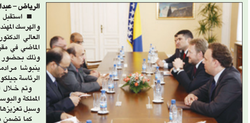
باكر عزت بيجوفيتش مستقبلاً الدكتور العنقري

وتم خلال المقابلة مناقشة أوجه التعاون بين المملكة والبوسنة والهرسك في مجال التعليم العالي وسبل تعزيزها. كما تضمن برنامج الوزير العنقري في البوسنة والهرسك زيارة جامعة سراييفو، حيث التقى