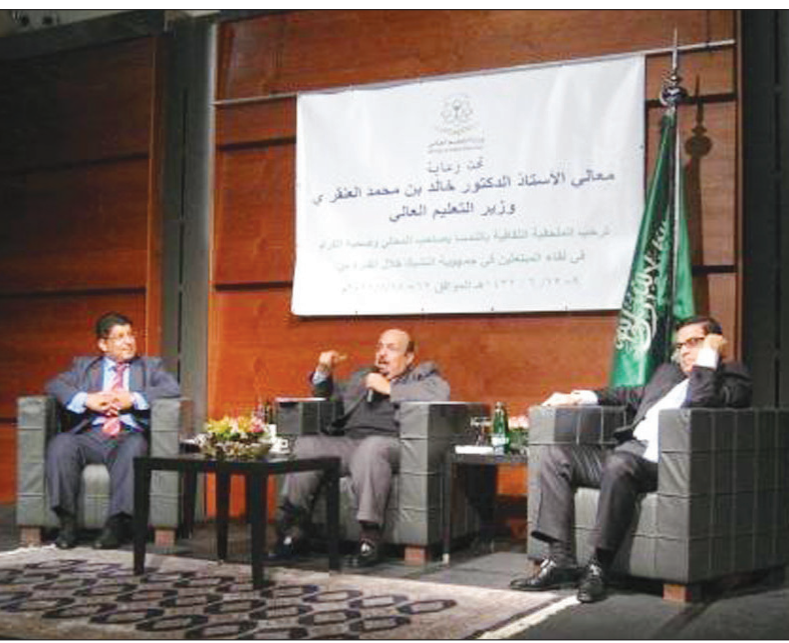
د. خالد العنقري خلال اللقاء

الرياض-عبدالله الحسني قال وزير التعليم العالي الدكتور خالد بن محمد العنقري إن الطالب المتبعث هو سفير بلاده ، ومراة يعكس من خلالها قيمه الدينية والثقافية والوطنية. جاء ذلك خلال لقاء معاليه مع الطلاب والطالبات المتبعين في أحد فنادق العاصمة التشيكية براغ مساء أمس الاول . وأشار إلى أن الطلاب المتبعين في جمهورية التشيك جزء من منظومة برنامج خادم الحرمين الشريفين للابتعاث البالغ عددهم أكثر من مائة ألف متبعث في معظم جامعات دول العالم . ولفت وزير التعليم العالي إلى اهتمام قيادة المملكة بالتعليم العالي والنهضة التعليمية التي تشهدها حالياً ، سواء على المستوى الداخلي أو الخارجي. وقال : لقد تبنت قيادة المملكة دعم خطط التنمية التعليمية في الداخل بالتوسع في التعليم الجامعي وزيادة أعداد الجامعات ، ونوعية التخصصات في الجامعات التي تحتضن مايزيد عن مليون طالب وطالبة. وأضاف معاليه إلى توسع في التعليم الخارجي عن طريق برنامج الابتعاث الذي تطور بشكل كبير ، وانضم إليه عشرات الآلاف من الطلاب في معظم جامعات العالم . ونبه الدكتور العنقري إلى نتيجة برنامج الابتعاث الإيجابي على كافة المستويات ، وتأثيره هؤلا الطلاب في التنمية مستقبلاً ، منوها إلى اتساع ثقافة الطلاب بإتقان أكثر من لغة ، وامتناجهم بالعديد من الحضارات