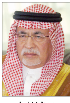
د. عبدالعزيز خوجة

ودعا وزير الثقافة والإعلام بهذه المناسبة مجالس الأندية الأدبية لسرعة حصر أعداد المتقنين في محيط أنديتهم وتشكيل الجمعيات العمومية لانتخابات مجالس إدارتها كل ناد حسب تواريخ انتهاء مددهم النظامية، مشدداً على أنه لن تتم عملية التجديد لأي مجلس إدارة حالي إلا وفق الانتخابات المقررة.