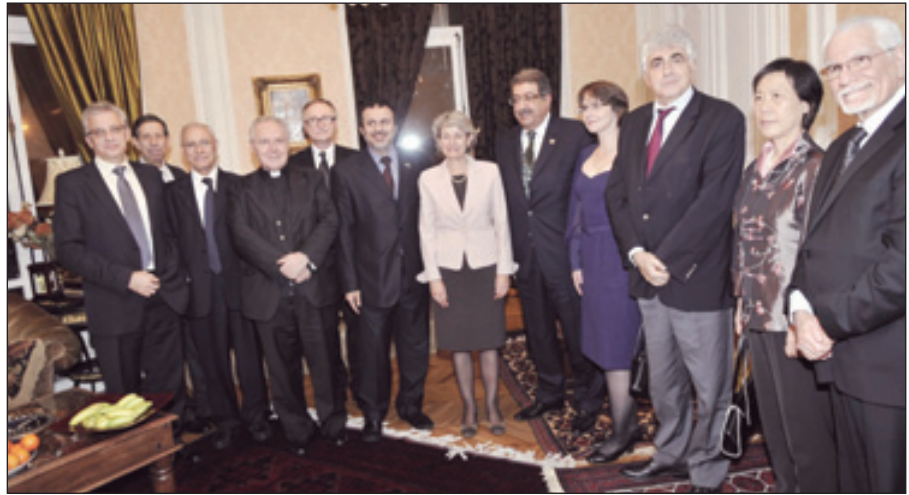
صورة جماعية للحضور