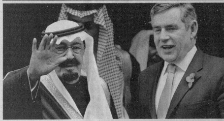
الملك عبد الله يوقع براون عند مقر رئاسة الوزراء في لندن أمس 1 أ. ب.

متبادلة وتقام. ومن ثم فاني أرحب بكم أيها الملك عبدالله خادم الحرمين بحارة في هذا البلد.