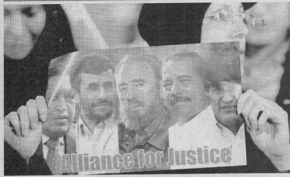
مائدة إفطار جماعية لزملاء لفوزلوا إيران وكوبا وبنغلادها وبنغلادها زيارة أورتيجا لجامعة طهران.

ومن جانبه رفض المستشار فونترا رئيس مكتب الاستخباراتي طلب وزير الخارجية الأمريكي سرجي لاروف وقف القواعد مع الولايات المتحدة بشأن نظام دفاع صاروخي أمريكي في وسط أوروبا فيما صوتت ثلثي من تشيكية أخرى ضد إقامة