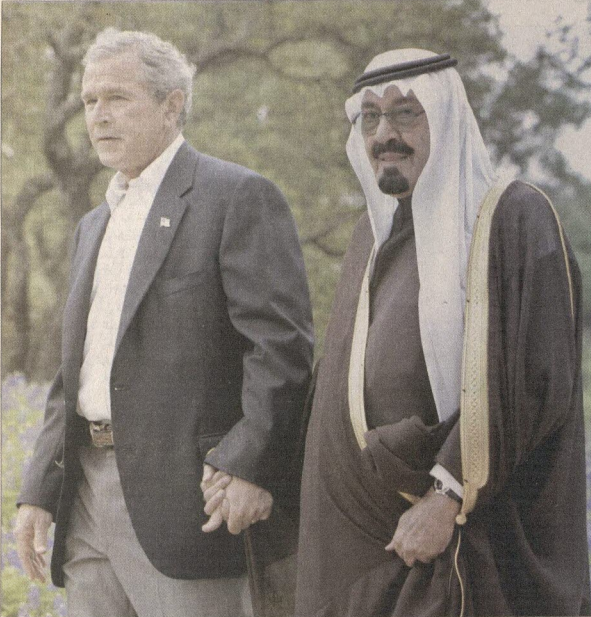
الملك عبدالله مع الرئيس الامريكى جورج بوش خلال زيارته الاخيرة الى الولايات المتحدة