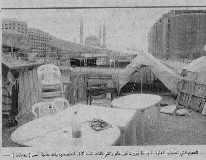
التيام التي تصفيا المعارضة وسط بيروت قبل ايام والي كانت تضم اذ المتصميم بنه خالبا أس (روترز) -

بشأن الولاة لقوى خارجية قفلاً «ان ارتهان بعض اللبنانيين الى هذه او تلك من البلدان او القوى السياسية الخارجية جعلهم أسرى مواقفهم وشل ما لهم من قدرات». وتدمع الولايات المتحدة وفرنسا والسعودية تحالف الأغلبية بينما تدعم سوريا وايران المعارضة.