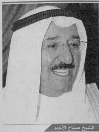
الشيخ صباح الأحمد

في الإسلام مراتب أعلاها الحرب. وأشار أعماله التنقيب الإسرائيلية بالحرب من مدخل الحرم القدسي الذي يضم المسجد الأقصى احتجاجات فلسطينية وعربية، وتقول إسرائيل إن الحفر لن يلحق ضرراً بالمسجد. لكن مجمع البحوث الإسلامية بالأزهر وصف في بيان وزع في المؤتمر الصحفي لشيخ أعمال التنقيب الإسرائيلية بأنها «عدوان أثم على المسجد الأقصى».