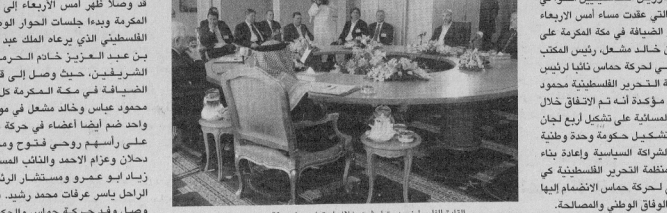
القادة الفلسطينيون يتباحثون خلال اجتماعهم في مكة.