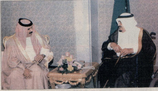
العمل الملكي وخادم الحرمين الشريفين في صورة أرشيفية

السعودية وصاحب السمو الملكي الامير سلطان بن عبدالعزيز آل سعود ولي العهد ولي اسرة آل سعود الكرام وحكومة وشعب المملكة العربية السعودية، داعياً للمواصلة على ما وجدنا من تقفد الفيدق بواسع رحمته ويسكنه فسيح جناته ويلهم لاسرة الملكة في المملكة العربية السعودية والشعب السعودي الشقيق الصبر والسلوان. وإننا لله وإنا إليه راجعون. هذا وقد صر عن صاحب السمو الشيخ خليفة بن سلمان آل خليفة رئيس الوزراء الموقر حفظه الله قرأنا فيه، بعد ختامه على روح الفيدق الراحل المغفور له خادم الحرمين الشريفين الملك فهد بن عبدالعزيز آل سعود عامل المملكة العربية السعودية يعطل العمل في جميع وزارات الدولة واداراتها ومؤسساتها الحكومية مدة ثلاثة ايام اعتباراً من يوم الثلاثاء 2005/8/2، كما يعلن الحداد وتنكس الاعلام على دور وزارات الدولة واداراتها ومؤسساتها مدة اربعين يوماً.