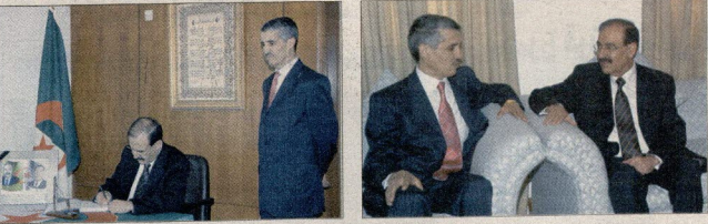
باستشهاد دبلوماسيين جزائريين