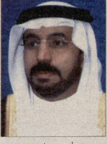
أحمد بن سلوم

يعتذر محافظ المحافظة الشاملة أحمد حسن بن سلوم عن استقبال المواطنين والقيمين الكرام في مجلسه الأسبوعي الذي يقف مسك على سبيل في حقائق بن سلوم على شارع الجبل القديم. وتقدم المحافظ بالترتيب الجزيل لكل ضيوف المجلس الأسبوعي من مواطنين وقيمين الذين يشرفون المجلس بحضورهم الكريم تأسبلاً لهذه العادة الإسلامية البحرينية الأصيلة تعريفاً لروح التضاد والتكافل الاجتماعي على أن يتم الإعلان في المستقبل عن استئناف عقد المجلس.