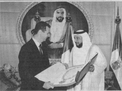
رئيس دولة الإمارات يسلم الرئيس السوري وسام الإمارات أمس أيا

البلدين متها. وقالت مصادر دبلوماسية قريبة من المباحث إن الجانبين تفرقا أيضا خلال الاجتماع «الى جهود المصالحة اللبنانية التي قامت بها قطر مؤخرا تحت رعاية جامعة الدول العربية، وعودة الأوضاع الطبيعية في لبنان عقب اتفاق الدوحة وانتخاب الرئيس اللبناني العام ميشال سليمان». ورفضت المصادر الحديث عما إذا كانت زيارة مبارك للمجلس تهدف إلى مصالح مع سوريا. وكان الرئيس المصري وصل في وقت سابق أمس إلى السعودية في زيارة لم يعلن عنها سبقا استمرت عدة ساعات. الى ذلك، اختتمت وزير الخارجية اللبناني فرانك فائزر شتاتينامير أمس محادثاته لبنان بزيارة قوات بلاده التي تعمل ضمن قوة العمل البحرية التابعة للاتحاد من قبالة الساحل اللبناني. وقال شتاتينامير خلال مؤتمر صحافي بعد الاجتماع مع رئيس الوزراء المكلف فولاذ السليوية والرئيس ميشال سليمان أن انتخاب رئيس وتشكيل حكومة في لبنان مؤشرا تبعث على الامل، مؤكدا أن اتفاق الدوحة بنص على انه لا يتعين استخدام القوة والاسلحة لتسوية النزاع، ويتعين على الحكومة ان تعمل بشأن نزح سلاح كل المليشيات.