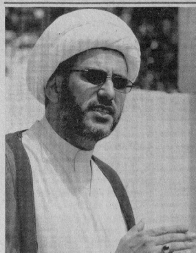
المخيم بالمسجد بفتح السيد الشيخ صالح العبدوي خلال مؤتمر الصحفي أسبوعياً