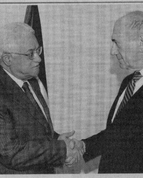
أولمرت يستقبل عباس في منزله بالقدس أسبوعياً

من إسرائيل لتفكيك عملية اجتياح واسعة في القطاع وأشهر الصدر في تصريحه لصحيفة «الأخبار» اللبنانية في عهدها للصال أسن إلى أن «التوافق لا يدرج في سياق تهمة من جانب واحد بل جاء في ظل معلومات مؤكدة من مصادر غربية مؤنولة تفيد بأن إسرائيل تستعد لتفكيك مخطط كبير في المستقبل يتضمن عملية اجتياح موسعة تسبها عملاً استراتيجياً ستترتب على قادة الزعماء العسكريين لحركتي حماس والجهاد الإسلامي لاستجلاب ردة فعل من جانب فصائل المقاومة تتر العملية العدوانية الموسعة ضد القطاع». في غضون طلبت حركة المقاومة الإسلامية «حماس» من الجزائر التوسط بينها وبين حركة فتح من أجل توحيد الصف الفلسطيني. وقال أسامة حداد عضو المكتب السياسي لحركة حماس وممثلها في لبنان في تصريحات نشرت أمس بالجزائر «لقد طلبنا رسمياً وسافة الجزائر لمصاحفة الفلسطينية من طرف الرئيس الجزائريين. إيجابياً من طرف الرئيسين الجزائريين. وأضاف «تتمتع من الجزائر أن نفتح دوراً في مصالحه الفلسطينية مع بعضهم».