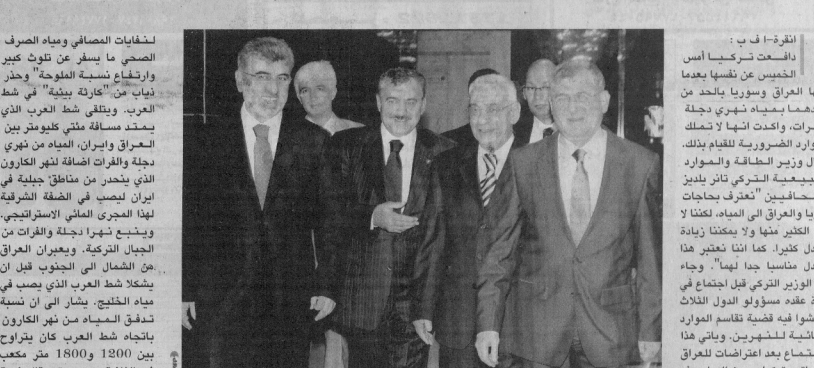
وزراء الطاقة (يسار) والبيئة التركيان ووزراء الري السوري ووزير المياه العراقي لدى وصولهم لمحمور لاجتماع في لفره