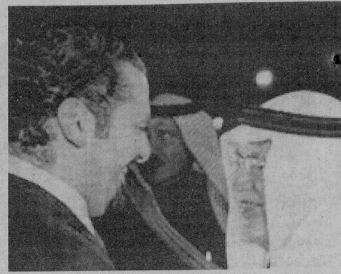
• وزير خوجة مستقبلاً الحريري

الرياض - العربية نت: في خطوات متسارعة للمؤامرات اللبنانية بعد نيل الحكومة ثقة البرلمان، وصل رئيس الوزراء اللبناني سعد الحريري إلى الرياض في زيارة رسمية للمملكة العربية السعودية، يلتقي خلالها المعامل السعودي الملك عبدالله بن عبدالعزيز ومسؤولين آخرين، في حين توجه الرئيس اللبناني ميشال سليمان إلى واشنطن في أول زيارة رسمية له إلى الولايات المتحدة يلتقي خلالها الرئيس باراك أوباما. وأوضحت وكالة الأنباء السعودية أن الحريري وصل إلى الرياض مساء الجمعة، حيث كان في استقباله معطر الملك خالد الدولي وزير الثقافة والإعلام عبد العزيز خوجة والسفير السعودي في لبنان علي عواض عسيري، والسفير اللبناني في السعودية مروان زين. من جهتها ذكرت وكالة الإعلام اللبنانية الرسمية أن الحريري يقوم «بزيارة رسمية يقابل خلالها خادم