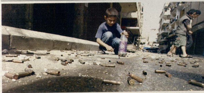
ظل لبناني يجمع أطلال قصاصات متناثرة على الأرض بمدينة طرابلس عقب اشتباكات ليلية بين أنصار الحكومة والمعارضين بالبحرين، «رويترز»

سوريا عطلت الإذاعة .. ومليشيا حزب الله تنقل المعارك إلى جبل لبنان