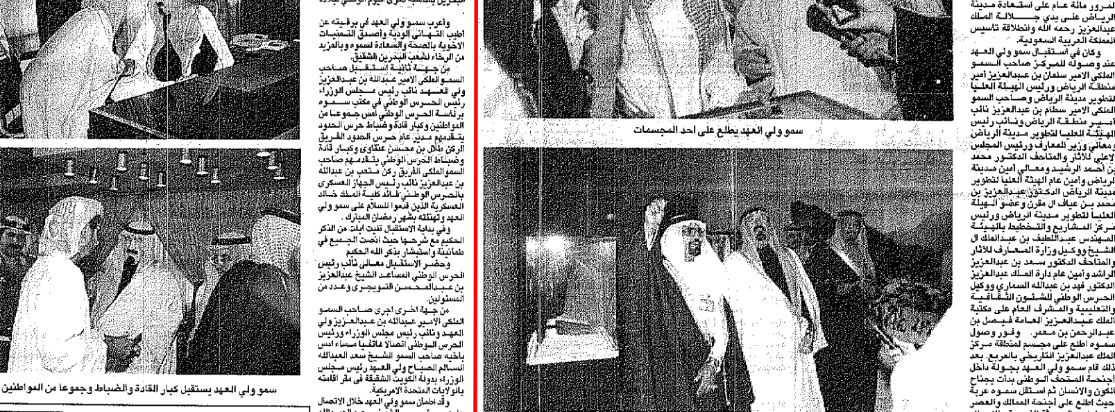
سمو ولي العهد يزور مركز الملك عبدالعزيز التاريخي، وذلك في إطار جولته التوعوية في مختلف مناطق المملكة.

قام ولي العهد الأمير محمد بن سلمان بن عبدالعزيز آل سعود، في زيارة رسمية إلى مركز الملك عبدالعزيز التاريخي، وذلك في إطار جولته التوعوية في مختلف مناطق المملكة. رافق ولي العهد في الزيارة عدد من المسؤولين الحكوميين، حيث استقبله مدير المركز الدكتور عبد العزيز بن عبد الله بن عبد العزيز آل سعود، ورافقهم في الجولة مدير العلاقات العامة الدكتور محمد بن عبد العزيز بن عبد الله بن عبد العزيز آل سعود، ومدير التسويق الدكتور أحمد بن عبد العزيز بن عبد الله بن عبد العزيز آل سعود. والتقى ولي العهد مع مدير المركز الدكتور عبد العزيز بن عبد الله بن عبد العزيز آل سعود، وناقش معه خطط المركز المستقبلية، واهتمامه بتطوير الخدمات المقدمة للزوار، وحرصه على تقديم أفضل خدمة ممكنة للزوار، واهتمامه بتطوير الخدمات المقدمة للزوار، وحرصه على تقديم أفضل خدمة ممكنة للزوار.