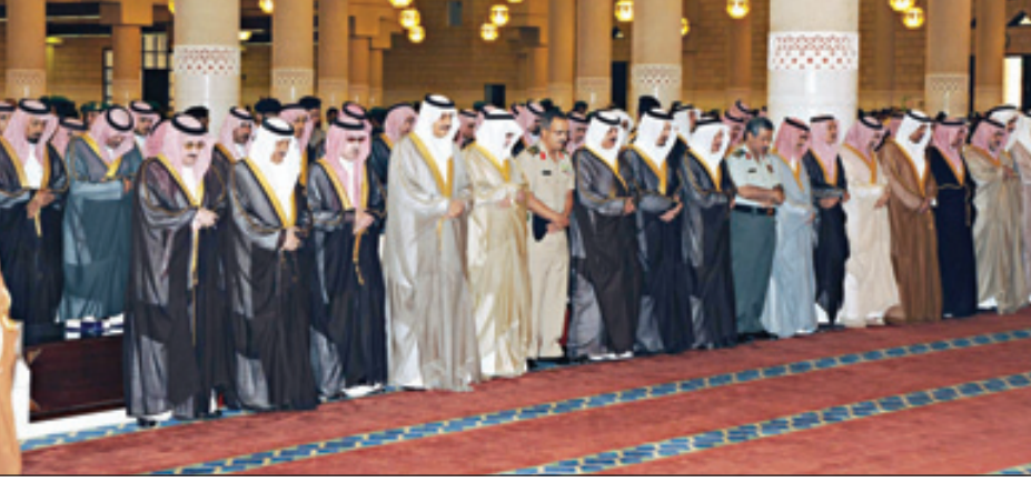
الأمرء وجموع المواطنين يؤدون الصلاة على الأميرة قماش رحمها الله

الوزراء وكبار المسؤولين وجمع من المصلين . وعقب الصلاة تقبل خادم الحرمين الشريفين العزاء من أصحاب السمو الملكي العلماء وأصحاب المعالي الوزراء وجمع المصلين . تغمد الله الفقيدة بواسع رحمته وأسكنها فسيح جناته.