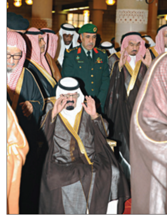
خادم الحرمين يؤدي الصلاة على الأميرة قماش تغمدها الله برحمته

وقد أدى الصلاة مع خادم الحرمين الشريفين - أيده الله - صاحب السمو الملكي الأمير متعب بن عبدالعزيز وصاحب السمو الأمير عبدالله بن محمد بن عبدالعزيز وصاحب السمو الأمير عبدالرحمن بن عبدالله بن عبدالعزيز وصاحب السمو الأمير خالد بن عبدالله بن عبدالعزيز وصاحب السمو الملكي الأمير سطاتم بن عبدالعزيز أمير منطقة الرياض بالنيابة