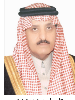
الأمير أحمد بن عبدالعزيز

■ يدشن صاحب السمو الملكي الأمير أحمد بن عبدالعزيز الرئيس الفخري للجمعية السعودية الخيرية لمرض الزهايمر قاعدة البيانات الوطنية التي أسستها الجمعية بالتنسيق مع مستشفى الملك فيصل التخصصي