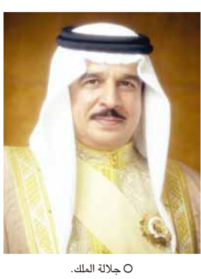
○ جلالة الملك .

الملك يت رأس وفد المملكة إلى القمة الخليجية بالكويت يعلن الديوان الملكي أن حضرة صاحب الجلالة الملك حمد بن عيسى آل خليفة عاهل البلاد المفدى سيغادر أرض الوطن اليوم الثلاثاء الموافق للعاشر من شهر ديسمبر الجاري متوجهاً إلى دولة الكويت الشقيقة ليرأس جلالتة وفد مملكة البحرين إلى أعمال الدورة الرابعة والثلاثين للمجلس الأعلى للتعاون لدول الخليج العربية التي تستضيفها دولة الكويت اليوم وغداً العاشر والحادي عشر من ديسمبر الجاري .