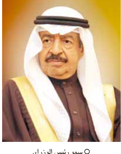
○ سمو رئيس الوزراء .

أكد صاحب السمو الملكي الأمير خليفة بن سلمان آل خليفة رئيس الوزراء أن قمة الكويت التي تعقد اليوم يجب أن تؤسس لمرحلة جديدة من مراحل العمل الخليجي المشترك.. فالواقع الجديد يحتم علينا التعامل بطرق غير تقليدية.. مجرباً سموه عن ثقته بأن أصحاب الجلالة والسمو سيخرجون من قمة اليوم بقرارات ونتائج مخرمة.. وقد أصبح الاتحاد الخليجي مطلباً ملحاً أكثر من أي وقت مضى.. وكل شعوب المجلس تتطلع إلى تحقيق ذلك الحلم.. فالوقت قد حان من دون تأخير أو إبطاء.