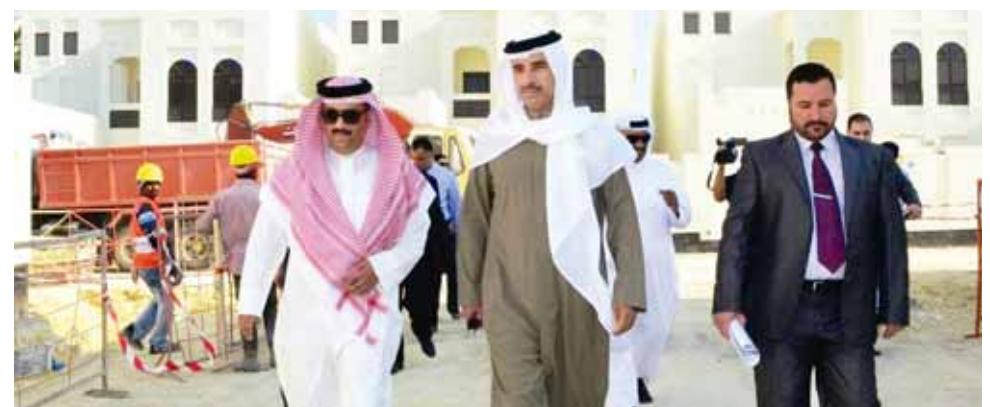
○ الوزير يتفقد المشاريع.

وأشار وزير العمل السيد جميل بن محمد علي حميدان في ورقته أيضاً أهم المشاريع التي تنفذها وزارة العمل في مملكة البحرين خلال العام الجاري، وذلك على ضوء قراءة مفصلة لاحتياجات سوق العمل، وفي مقدمة تلك المشاريع مشروع توظيف وتدريب البحرينيين (٢) الذي