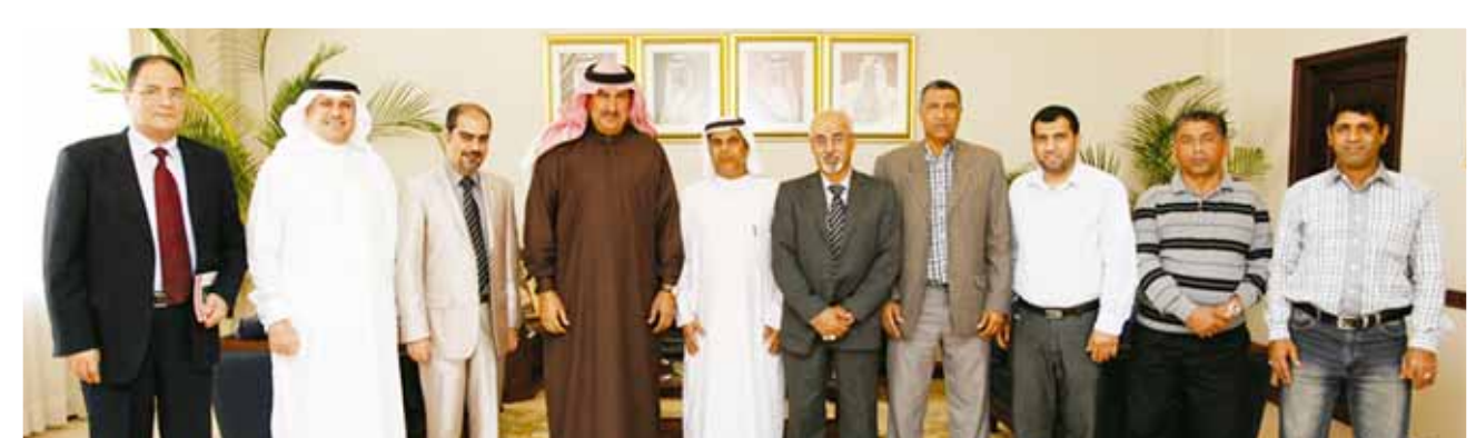
○ خلال اللقاء.

عدد من الموضوعات ذات العلاقة، وعلى رأسها استعانة النقابة بالرأي القانوني في شأن المنازعات العمالية الفردية منها والجماعية، وتفعيل الحوار الاجتماعي بين طرفي الإنتاج بما ينمي العلاقة بين مجلس إدارة الشركة والنقابة.