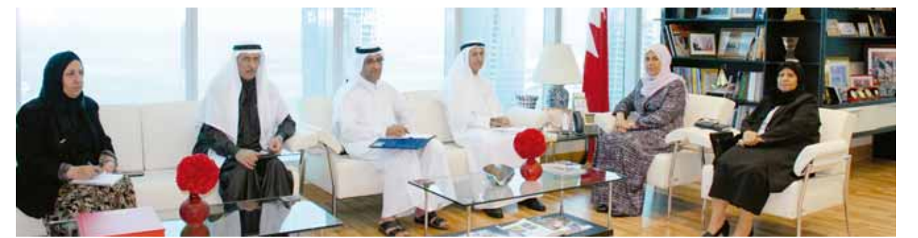
○ وزيرة التنمية خلال استقبال المسئول القطري.

يعتمد على ربط التدريب بالواقع والاحتياج، ومواكبة كل جديد. ودعا في ختام كلمته المرشحين الضباط إلى التحلي بالأخلاق العسكرية والتبليّة المستمدة من ديننا الإسلامي الحنيف وقيمنا العربية الأصيلة