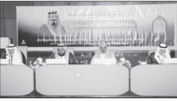
د. أبا الخيل مفتتحاً الندوة

الرياض - متعب ابوظهير: أكد مدير جامعة الإمام محمد بن سعود الإسلامية الأستاذ الدكتور سليمان بن عبدالله أبا الخيل أن خادم الحرمين الشريفين الملك عبدالله بن عبدالعزيز آل سعود - حفظه الله - رائد تبادل الثقافات والحوار، مشيراً إلى أن ندوة (جهود خادم الحرمين الشريفين في نشر ثقافة الحوار)، تصب في تحقيق مبادرته - حفظه الله - في الحوار.