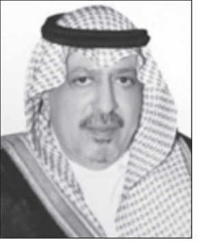
الأمير عبدالله بن خالد بن عبدالعزيز

أبها - حياة الغامدي رفغ رئيس مجلس أمناء مؤسسة الملك خالد الخيرية صاحب السمو الملكي الأمير عبدالله بن خالد بن عبدالعزيز باسمه وأعضاء مجلس أمناء المؤسسة ومنسوبيها تهانیه لمقام خادم الحرمين الشريفين وسمو ولي عهده الأمين وكافة أفراد الشعب السعودي بمناسبة الذكرى السادسة لبيعة خادم الحرمين الشريفين الملك عبدالله بن عبدالعزيز حفظه الله. وقال سموه تأتي الذكرى السادسة للبيعة هذا العام والملكة تعيش نهضة كبرى في كل شئ ووطنها، وعجلة التنمية ومسيرة الرخاء تشهد تقدماً في كافة جوانب الحياة السياسية والاقتصادية والاجتماعية منذ تولي ولياً ملكاً دفة الحكم قبل ست سنوات، مؤكداً أن المواطن كان وما زال محور اهتمام القيادة الرشيدة التي بذلت ما يمكن بذله لإسعاده وتوفير الحياة الكريمة له في شتى المجالات.