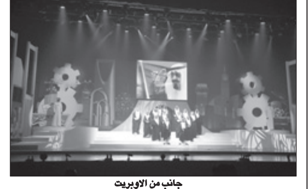
جانب من الأوبريت

محمد علي بخاري الحان موسى جيزاني توزيع خالد جودة ديكور محسن السري الاشراف الفني عبدالله باحطاب الرؤية والإخراج عبد الرزاق العاوي. والذي عكس فرحة منسوبي الجامعة وطلابها بمناسبة ذكرى البيعة السادسة لمولاي خادم الحرمين الشريفين. واستهل الأوبريت بحوار يحكي قصة نجاحات وإنجازات تمت في عهد خدام الحرمين الشريفين كما خصصت اللوحة الأولى للنهضة التعليمية في المملكة، والنهضة الصناعية،