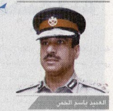
العميد باسم الحران

كتب - رضا الإبراهيم: أكد الوكيل المساعد للشؤون الإدارية بوزارة الداخلية العميد باسم الحران أن الوزارة فعلة على تنفيذ خطة تطوير بعيدة المدى، تشمل تأهيل الكوادر على المستوى التعليمي والأكاديمي. وحول ملاحج التطوير الذي تسعى إليه الوزارة، أشار العميد الحران