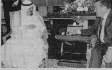
الرئيس المصري والعاهل السعودي خلال قمة شرم الشيخ أسس.

وكان العاهل السعودي والوفد المرافق له قد وصل إلى مدينة شرم الشيخ مساء أسس في زيارة قصيرة لمسح تسرقق ساعات. وكان الرئيس المصري على رأس مستقبليه بجمار شرم الشيخ. وضم الوفد السعودي المرافق للملك عبدالله، الأمير سعود الفيصل وزير الخارجية والأمير مقرن عبدالعزيز آل سعود رئيس استخبارات العامة والأمير فيصل بن عبدالله محمد آل سعود مساعد رئيس الاستخبارات العامة، كما ضم الوفد السفير هشام ناظر سفير السعودية بالقاهرة.