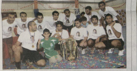
● الفريق الماجد مع كأس البطولة