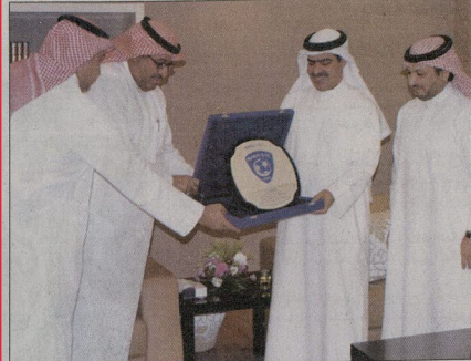
● الأمير نواف بن محمد يقدم العضوية الشرفية للشيخ فوز

تحت رعاية الشيخ فوز بن محمد آل خليفة رئيس المؤسسة العامة للشباب والرياضة أقامت المؤسسة العامة حفل التكريم السنوي للموظفين (علاؤكم بطن) مساء يوم الاثنين الماضي في فندق (كراون بلازا) وذلك تكديراً لجهود جميع العاملين في المؤسسة العامة وخطابهم المتميز من أجل النهوض بقطاع الشباب والرياضة في المملكة. وقد بدأ الحفل بكلمة للشيخ عبدالله بن راشد آل خليفة مدير إدارة الموارد البشرية والمالية، تناول فيها الإنجازات الإدارية المتعددة للمؤسسة خلال العام الجاري وأبرزها حصول المؤسسة على جائزة أفضل وزارة متطورة إلكترونياً ضمن جائزة