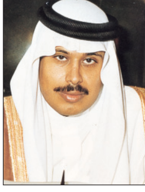
الأمير مشاري بن سعود

عبدالعزیز حفظه الله تمكن من تحقيق إنجازات عظيمة في جميع الجوانب للمواطن والوطن لا يقاس حجمها وإنجازها بعدد الأيام والسنين كون الملك حفظه الله كان التحدي الكبير مع الوقت فتمكن رعاها الله بحسن نواياه وصدق سريرته أن تتوابع الإنجازات على كل شبر من الوطن وتحولت الملكة إلى ورشة بناء ونماء يصعب على التاريخ نسيان أو تجاهل تلك الإنجازات