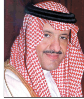
الأمير سلطان بن سلمان

الرياض - "واس" نوه صاحب السمو الملكي الأمير سلطان بن سلمان بن عبدالعزيز رئيس الهيئة العامة للسياحة والآثار بما تحققت للمملكة العربية السعودية منذ مبايعة خادم الحرمين الشريفين الملك عبدالله بن عبدالعزيز آل سعود ملكاً للبلاد من نقلات تنموية شاملة وإنجازات جليلة تميزت بالتكامل وطرحه - أيده الله - لمبادرات كبرى لتحديث المملكة في شتى المجالات بما يتواءم مع متطلبات العصر الحاضر، ويضع المملكة في مصاف الدول المتقدمة. وأوضح سموه في تصريح بمناسبة الذكرى السادسة لمبايعة خادم الحرمين الشريفين أن هذه الإنجازات تشكل امتداداً لمسيرة الدولة الحديثة التي أسسها الملك عبدالعزيز بن عبد الرحمن آل سعود - رحمه الله - وتولى قيادتها أبناءه الملوك من بعده - رحمهم الله - وصولاً إلى هذا العهد الزاهر الذي يقود فيه خادم الحرمين الشريفين الملك عبدالله بن عبدالعزيز - حفظه الله - البلاد بعزم لا يعرف الكلل، وتفان في خدمة الوطن والأمة العربية والإسلامية والمجتمع الإنساني بأكمله. وقال سموه إنه من الصعب اختزال المنجزات التي تحققت لبلادنا منذ تولي خادم الحرمين الشريفين مقاليد الحكم قبل ست سنوات، حيث شهدت المملكة تحديث العديد من الأنظمة، وإنشاء ودعم الكثير من المشاريع والبنى التحتية الجديدة والخطط الحديثة في جميع مناطق المملكة، وسن الأنظمة الجديدة المتوakمة مع حركة التطور السريعة، والرامية إلى رفعة المواطن