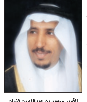
الأمير سعود بن عبدالله بن ثنيان