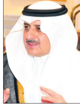
الأمير فهد بن سلطان

ولله الحمد أولاً وآخر من إنجازات حضارية أصبحت مفاخر إعجاب وإكبار على مختلف الصعد. وخادم الحرمين الشريفين - حفظه الله - ارتبط بعلاقة وثيقة بهذه هذه البلاد وتقدمها منذ عقود وتوجت في ست سنوات كان الإنسان السعودي وسائر منطلقاته في مقدمة وأهم الأولويات. وهو ما أكدته - أيده الله - في مواقف عدة أن المواطن هو هدفه وغايته، وان شغفه الشاغل إحقاق الحق وإرساء العدل وخدمة