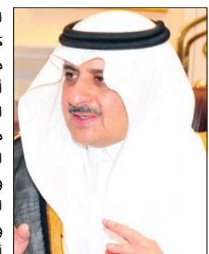
الأمير فهد بن سلطان

ولله الحمد أولاً وآخر من إنجازات حضارية أصبحت مفار إعجاب وإكبار على مختلف الصعد. وخادم الحرمين الشريفين - حفظه الله - ارتبط بعلاقة وثيقة بنهضة هذه البلاد وتقدمها منذ عقود وتوجت في ست سنوات كان الإنسان السعودي وسائر منطلقاته في مقدمة وأهم الأولويات. وهو ما أكدته - أيده الله - في مواقف عدة أن المواطن هو هدفه وغايته، وأن شغفه الشاغل إحقاق الحق وإرساء العدل وخدمة