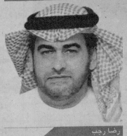
عضو لجان تنظيم المؤتمر

في هذا المؤتمر إيماناً منها بأهمية هذا الموضوع الحيوي لا سيما في هذه الفترة العصيبة من تاريخ أمتنا. وأرفق: بحث المؤتمر أهمية الأسرة وتماسكها ومواجهة أفات الإرباب والمخدرات وغير ذلك من المواضيع إضافة إلى معالجة أحد محاوره لقضية الحملات على الإسلام وعلى رموزه والمسلمين المنتشرين في أنحاء العالم.