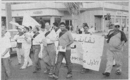
اتصام لعمال شركة بتلكو