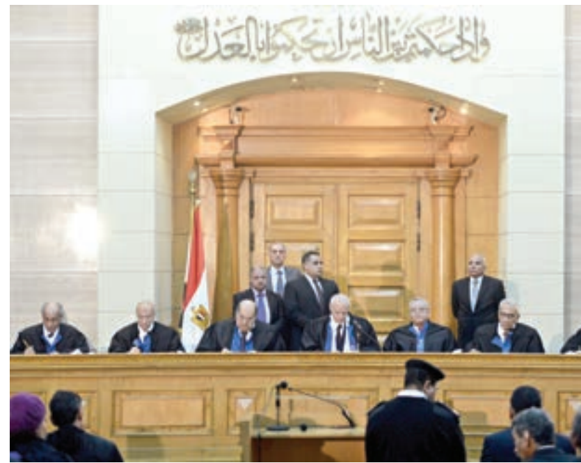
□ المحكمة الدستورية المصرية خلال جلستها أمس.

وسيتألف مجلس النواب القادم من 567 مقعداً سينتخب 420 من شاغليها بالنظام الفردي و120 بنظام القوائم المغلقة المطلقة التي تتضمن حصة للنساء والأقباط والشباب. وسيعين رئيس الجمهورية خمسة بالمئة من نواب المجلس بما يعادل 27 مقعداً.