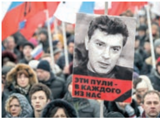
□ جانب من المسيرة.

وتم الحل بعد أخذ رأي الاتحاد العام للجمعيات والمؤسسات الأهلية، مضيفة أنه يجري حصر الأموال والممتلكات وإخطار اللجنة المشكلة لتنفيذ الحكم للنظر في التصرف فيها على أن تتولى الجهة الإدارية تعيين مصفيين للقيام بأعمال التصفية.