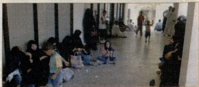
الاعتاميل بعتصمون امام مبنى الوزارة