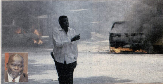
أحد متفري الشغب يبر من أمام سيارات تحرق بالخبرطوم اسب، وفي الأطار فريق «روبرتز»