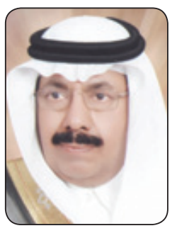
محمد بن عبدالله السلامة*

ومن أبرز ملامح التنمية التي تحققت خلال السنوات الست القليلة الماضية التي عمت من خلال مشاريع البناء في أرجاء الوطن في كل القطاعات والمدن الاقتصادية والمراكز الطبية في كل منطقة ولقد تحولت المملكة في عهد خادم الحرمين الشريفين إلى ورشة عمل ضخمة وإلى تطور هائل لا يتوقف منذ مبايعة إلى اليوم لا تمر مناسبة إلا وتصدر قرارات تنصب في مصلحة المواطن والوطن. أعطى جل وقته وصحته لخدمة هذا الوطن حيث ارتفع عدد الجامعات من ثمانية إلى أكثر من ثلاثين جامعة وافتتحت الكليات والمعاهد التقنية والصحية وكليات تعليم البنات حيث تعيش المملكة حاليا نهضة تعليمية وعرفية شاملة وجاء آخر هذه المنجزات تدشين الملك رعاء الله جامعة الأميرة نورة بنت عبدالرحمن كأكبر جامعة نسائية على مستوى العالم سيقام إقامة جامعة الملك عبدالله للعلوم والتقنية لتشكل لبنة جديدة تضاف إلى الجامعات السعودية الأخرى. وفي مجال الحوار العالمي