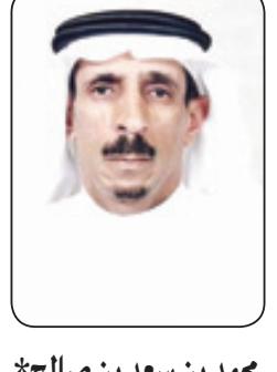
محمد بن سعد بن صالح*

■ نحل علينا في المملكة العربية السعودية هذه الأيام ذكرى عزيزة وغالية علينا وهي الذكرى السادسة لمبايعة خادم الحرمين الشريفين الملك عبدالله بن عبدالعزيز - حفظه الله - ملكا للمملكة العربية السعودية ، وقد شهدت بلادنا ولله الحمد في هذه السنوات العديد من المنجزات التنموية في جميع المجالات ولم تكن تلك السنوات الست الماضية سنوات عادية بل كانت سنوات شهدت الكثير من المشاريع والعطاء لهذا الوطن على الرغم من بعض المشاكل التي شهدتها العديد من دول العالم في حولنا وخصوصا في المجالات الاقتصادية إلا أن المملكة بفضل الله ثم بجهود خادم الحرمين الشريفين وتوجيهاته استمرت في تنفيذ المشاريع المقررة دون التأثر بتلك الأزمات الاقتصادية .