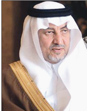
الأمير خالد الفيصل

أسرية إضافة لعقد ١٢٧ دورة أهلية استفاد منها ما يربو عن ٤٢٠٦ مستفيدين.