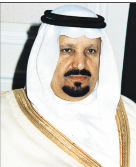
الأمير عبدالرحمن بن عبدالعزيز

ونوه اللواء إبراهيم الملك أن زيارة سموه التي عدونا عليها كل عام تأتي في إطار مشاركة سموه لأبنائه وإخوانه منسوبي القوات المسلحة في احتفالهم بمناسبة عيد الفطر المبارك التي هي جانب من متابعة سموه وحرصه الدؤوب على أن تكون القوات المسلحة في كامل جاهزيتها واستعدادها وأن