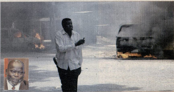
امد متجري الشغب يبر من امام سيارات تحترق بالخرطوم اسب، وفي الاطراف فريق روبرتوز.