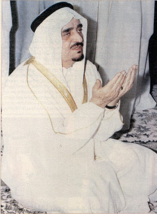
الراحل الملك فهد