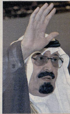
الملك عبدالله بن عبدالعزيز