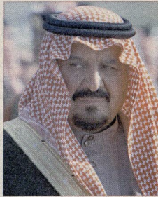
ولي العهد الامير سلطان بن عبدالعزيز