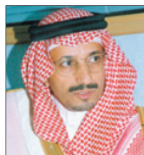
الدكتور علي بن ناصر الفقيص

أكد معالي محافظ المؤسسة العامة للتدريب التقني والمهني الدكتور علي بن ناصر الفقيص أن الوطن يعيش هذه الأيام مناسبة غالية على الجميع وهي تذكى توحيد المملكة العربية السعودية بفضل الله تعالى على يد المؤسس -رحمه الله- الذي كان يتوقى الله تعالى أهلاً ليحمل عبء توحيد المملكة. وأبرز اهتمام المملكة بالاستثمار في الإنسان، وتمكينه من المشاركة الفاعلة في مسيرة التنمية الوطنية الشاملة، ومن ذلك الدعم الكبير لتفعيل دور التدريب التقني والمهني في التنمية. وقال: لقد شهد المجتمع السعودي نهضة حضارية جديدة نتجت عن النمو الهائل لتطوير واستخدام التقنيات الحديثة، وبأتى التطوير التقني أحد شواهد العصر على هذا التقدم منذ تولي خادم الحرمين الشريفين الملك عبدالله بن