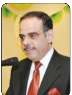
د. محمد بن إسماعيل آل الشيخ

في العصر الحديث، ونأى بمملكته عن كافة القلاقل التي كانت تعصف بدول العالم واضعاً الأسس الراسخة والمنهجية الواضحة المعتمدة على كتاب الله وسنة رسوله صلى الله عليه وسلم. وبعد أن استقرت له أمور دولته الفتية، أتجه لبناء علاقاته الدولية وفق إستراتيجية دبلوماسية تتسم بالحكمة وبعد النظر حيث عزز علاقاته مع الدول المحيطة بمملكته، والدول المهمة في المنطقة، ثم بدأ في النقاء قادة الدول الكبرى في العالم مؤسساً لعلاقات راسخة وشراكات إستراتيجية محكمة ومبنية على التعاون المبني على الاحترام المتبادل، تلك كانت الذكرى، أما المناسبة فهي أن