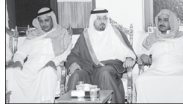
أمير نجران يتوسط اقارب الشهيد

الرياض- شباب الزلامي