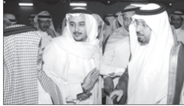
الأمير مشعل بن عبدالله يقدم التعازي