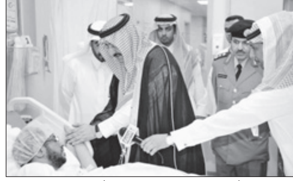
الأمير محمد خلال اطمئنائه على صحة الأكليبي.

منزل أسرة الشهيد بمحافظة بيشة ومدير شرطة محافظة بيشة العقيد شريع بن محمد الشهراني. وقال