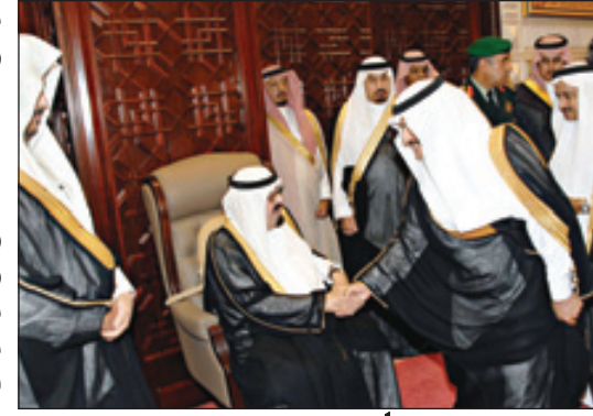
الملك مستقبلاً أعضاء مجلس الشورى (و اس س)

تغطية - عبدالسلام البلوي - محمد الشيباني - عبدالله الحسيني ألقى رئيس مجلس الشورى الشيخ الدكتور عبدالله بن محمد بن إبراهيم آل الشيخ خلال تشريف خادم الحرمين للمجلس أمس الكلمة التالية.. الحمد لله رب العالمين والصلاة والسلام على أشرف الأنبياء والمرسلين سيدنا ونبينا محمد وعلى آله وصحبه أجمعين وبعد: خادم الحرمين الشريفين الملك عبدالله بن عبدالعزيز أصحاب السمو الأمراء أصحاب السماحة والفضيلة والمعالى والسعادة أيها الحضور الكريم السلام عليكم ورحمة الله وبركاته ومرحباً بكم في رحاب مجلس الشورى