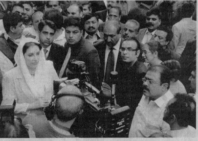
بوتو معاطة بويديها خلال مقابلة تلفزيونية في لندن اس من روبرترز