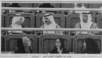
جانب من مناقشات المجلس الأسس، دوبريز،

يعمل صدر مبادئ الثورة. ويوضح: هذا النظام كليا ضد الثورة ولقيها. أصداء الثورة كانت الحرية والآن لتوجد حريات، وكان من أهدافها الاستقلال لأن إيران كليا معتمدة على السياسات الروسية والصينية والأمريكية وحتى تستمر تحتاج الجيم، الأمر ومن مبادئ الثورة التطوير، والآن لدينا مستوى عال من الفساد في الإدارة والجمعيتي ضد بني صدر أبداً، ولديها الحكومة الآن هي ضد مبادئ الثورة الإيرانية، وقال إن «مبدأ ولاية الفقيه ضد الإسلام وضد سماح في القرآن الكريم، ولا علاقة له بالإسلام وإنما مستمد من الفلسفة اليونانية والغربية وفلسفة أرسطو وليس من الإسلام والرسول». ويستطرد معبرا عن بعض آرائه: «أعتقد أيضاً أن العقاب ليس مستعداً من القرآن وإنما هو عرف وتقليد للناس أحزاب لتكساح وتزديد الجباب أو تبقى بلا حجاب».