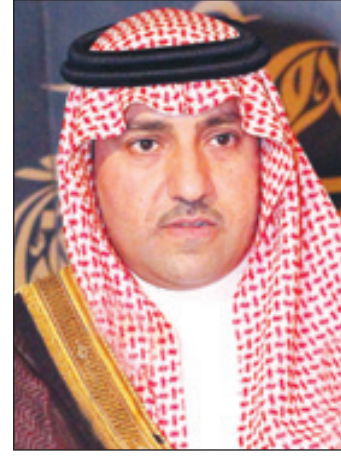
الأمير تركي بن عبدالله