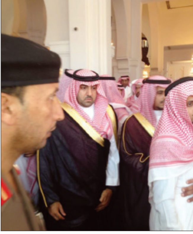
الأمير تركي بن عبدالله يتقدم المصلين للصلاة على الفقيد الحميضة رحمه الله

جدة - واس صدرت موافقة خادم الحرمين الشريفين الملك عبدالله بن عبدالعزيز آل سعود - حفظه الله - على منح أربعة مواطنين ميدالية الاستحقاق من الدرجة الثانية لقاء تبرع كل منهم بدمه خمسين مرة، وفيما يلي أسماء الممنوحين ميدالية الاستحقاق: عبدالله بن عبدالعزيز العبيد، يونس بن محمد الحافظ، عاطف بن عبدالرحيم بخاري، ماجد بن عيد الجهني.