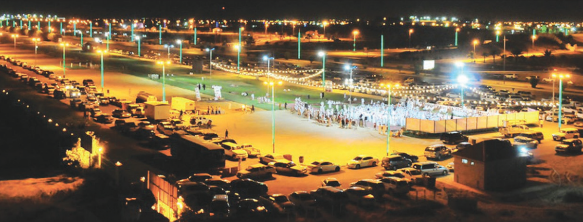
مغزاه الحاجب كما بدأ ليلة العيد

ومن هنا العروض وتضمنت عروضاً مرئية تناولت اللوحات التراثية في الماضي وعروض التحف والمقتنيات الأثرية وحياة الأسلاف وبرنامجه العبد في الماضي إلى جانب مشاركات الجاليات العربية والصديقة وعلى الصعيد نفسه تواصلت احتفالات عيد الفطر المبارك في عدد من المراكز والأحياء بمحافظة عنيزة بمشاركة عدد من الفرق الشعبية والفرق الترفيهية.