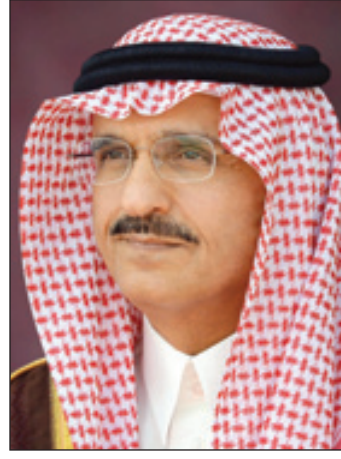
الأمير خالد بن بندر

الاحتفالات عند انتهاء مواسم الأعياد، بل تقدم رزنامة كاملة طوال العام تنوع بين المهرجانات الترفيهية والثقافية والمسرحيات والسنائية وكذلك الأسميات الشعرية وعروض الستاند أب كوميدي وغيرها. وحول الفعاليات المخصصة والموجهة لفئة الشباب، أوضح الدكتور الدجين أن ما يقارب من ٧٠