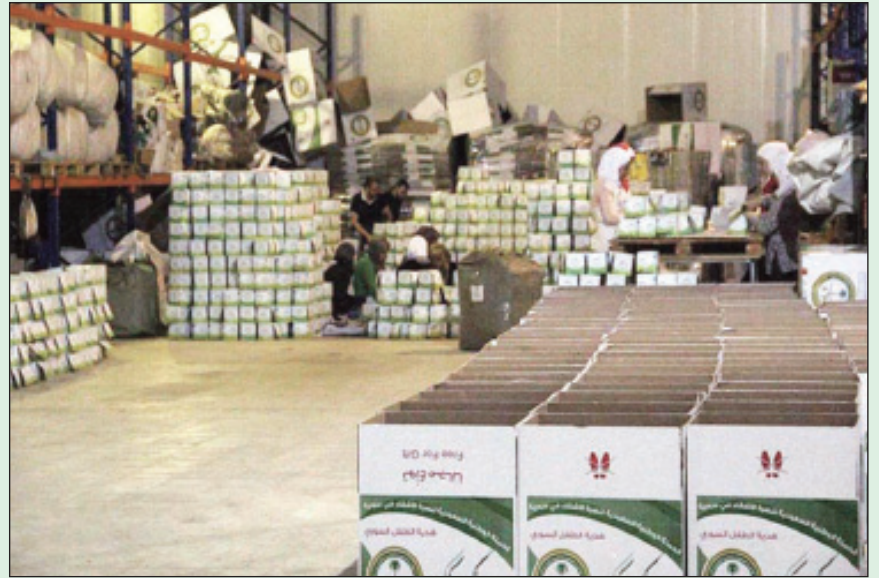
١٠٠ ألف هدية توزع على الأطفال السوريين