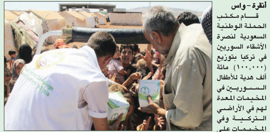
أعضاء الحملة يوزعون الهدايا