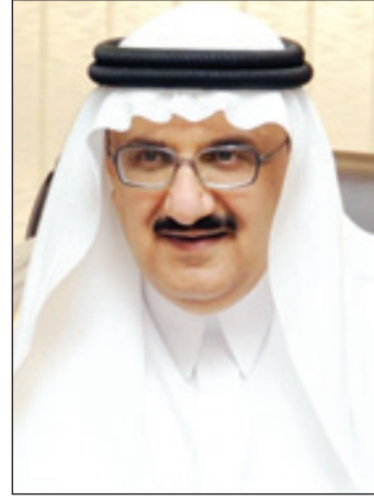
الأمير منصور بن متعب