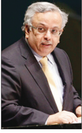
السفير عبدالله المعلمي

أيلول/ سبتمبر ٢٠١٦ اعتبرت مسألة إنشاء مركز دولي لمكافحة الإرهاب جزءاً من الجهود الدولية الرامية إلى تعزيز مكافحة الإرهاب. وفي أيلول/ سبتمبر ٢٠١١، وقّع اتفاق يتعلق بالمساهمات بين الأمم المتحدة والبعثة الدائمة للمملكة لدى الأمم المتحدة لإنشاء مركز الأمم المتحدة لمكافحة الإرهاب. من جهة أخرى أشاد الأمين العام لمنظمة التعاون الإسلامي البروفيسور أكمل الدين إحسان أوغلي بتبرع خادم الحرمين