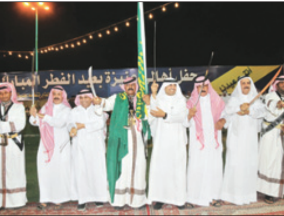
السليم يشارك بالعرضة السعودية