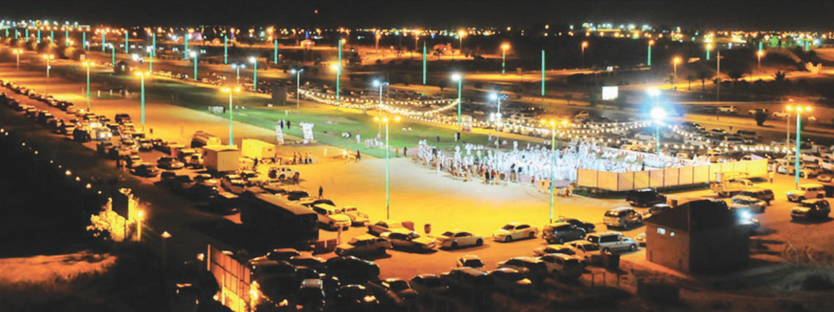
مغزاه الحاجب كما بدأ ليلة العيد

ومن هنا العروض وتضمنت عروضاً مرئية تناولت اللوحات التراثية في الماضي وعروض التحف والمقتنيات الأثرية وحياة الأسلاف وبرنامج العيدي الماضي الى جانب مشاركات الجاليات العربية والصديقة وعلى الصعيد نفسه تواصلت احتفالات عيد الفطر المبارك في عدد من المراكز والأحياء بمحافظة عنيزة بمشاركة عدد من الفرق الشعبية والفرق الترفيهية.