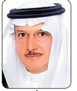
د. يوسف بن أحمد العثيمين

■ نعم الله الكثيرة على هذه البلاد بعد نعمة الإسلام أنه هيا لها قيادة حكيمة رشيدة خيرة تسعى لكل ما فيه خير الوطن والمواطنين تسعى لتسخير جل المطالب الخيرية والتنموية لأبناء هذا الوطن المعطاء