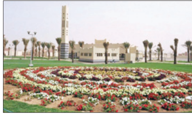
إسكان الملك عبدالله بجازان

*وزير الشؤون الاجتماعية المشرف العام على إسكان النازحين بالمنطقة الجنوبية