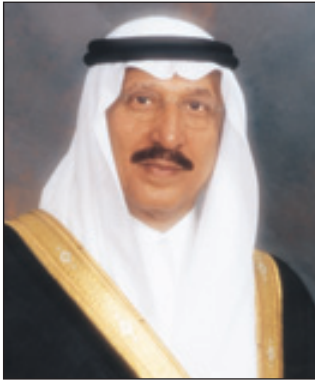
الأمير محمد بن ناصر