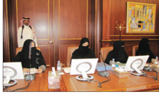
جانب من الحضور النسائي في الاجتماع.

عرضاً شاملاً عن الوضع القائم للجامعات والكليات الأهلية بالمنطقة ومدى الالتزام بالضوابط التعليمية والمهنية وإجراءات السلامة، وناقش الاجتماع مبريات الحضور حول نتائج الدراسة وإقرار التوصيات التي تضمنت اتخاذ كافة الإجراءات لمعالجة أوضاع الكليات الأهلية بشكل يضمن التزامها بجميع الضوابط والاشتراطات المنظمة لعملها لحماية حقوق الطلبة من الجنسين في الحصول على مستوى عال من التعليم والتدريب يؤهلهم بجودة عالية في التخصصات المطلوبة بها للمنافسة في سوق العمل وتحمل الجامعات والكليات المقصرة لكافة التبعات والتكاليف اللازمة لضمان حقوق خريجها، واستمرار أعمال اللجنة لمتابعة وضع الجامعات والكليات الأهلية في المنطقة مع كافة الجهات المعنية.