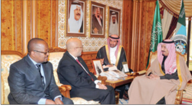
الأمير سلمان يستقبل سفير جنوب أفريقيا.