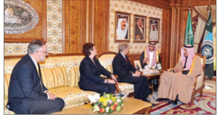
وزير الدفاع يستقبل نائب وزير الطاقة الأمريكي.

البلدين. حضر الاستقبالين صاحب السمو الملكي الأمير محمد بن سلمان بن عبدالعزيز المستشار الخاص لصاحب السمو الملكي الأمير سلمان بن عبدالعزيز وزير الدفاع ركن عبدالرحمن بن صالح البنبان.