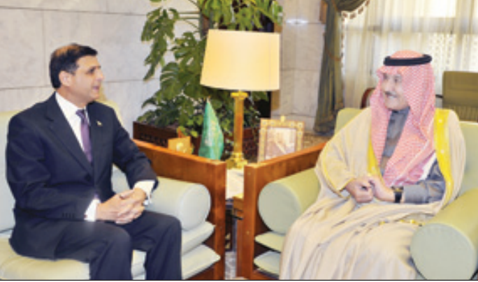
الأمير سطاتم يستقبل السفير الباكستاني