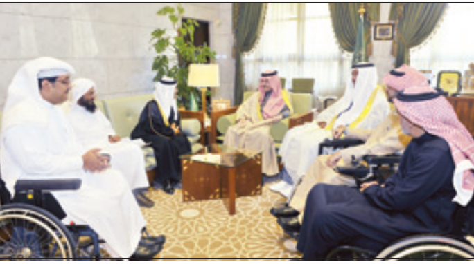
الأمير سطاتم يستقبل أعضاء جمعية حركية

الاجتماعي الذي يحث عليه الدين الإسلامي الحنيف، متمنياً للقائمين على الجمعية النجاح والتوفيق.