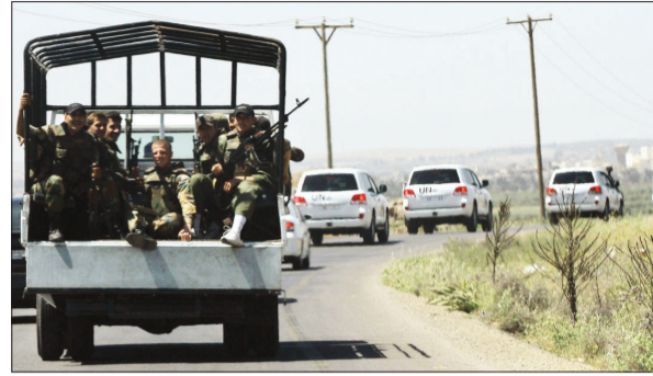
موكب المراقبين لدى دخوله درعا قبيل لحظات من الهجوم.