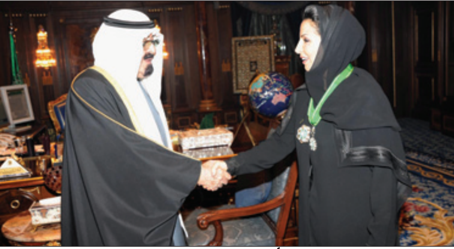
خادم الحرمين يقبل الدكتورة خولة الكريخ وسام الملك عبدالعزيز

أول سيدة خليجية تحصل على شهادة الدكتوراه.