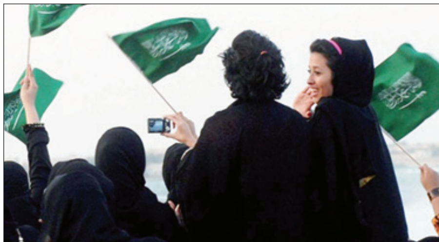
المرأة.. قصة عشق لا تنتهي للوطن وقيادته

وقد كرمت الإمارات العربية المتحدة الفائزات بجائزة معهد الشرق الأوسط للتميز (١١) للقيادات والمؤسسات التي لعبت دوراً متميزاً في تطوير الدور القيادية للمرأة في مسيرة التنمية، وحصلت الأميرة «أميرة الطويل» - حرم صاحب السمو الملكي الأمير الوليد بن طلال