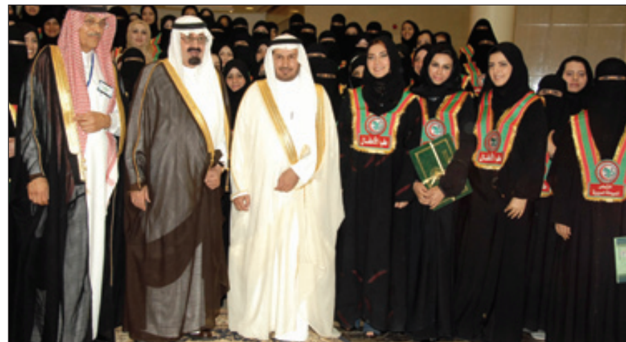
.. ويكرم خريجات الهيئة السعودية للتخصصات الصحية

أولاً: مشاركة المرأة في مجلس الشورى عضواً اعتباراً من الدورة القادمة وفق الضوابط الشرعية، ثانياً: اعتباراً من الدورة القادمة يحق للمرأة أن ترشح نفسها لعضوية المجالس البلدية، ولها الحق كذلك في المشاركة في ترشيح المرشحين بوضوابط الشرع الحنيف، من