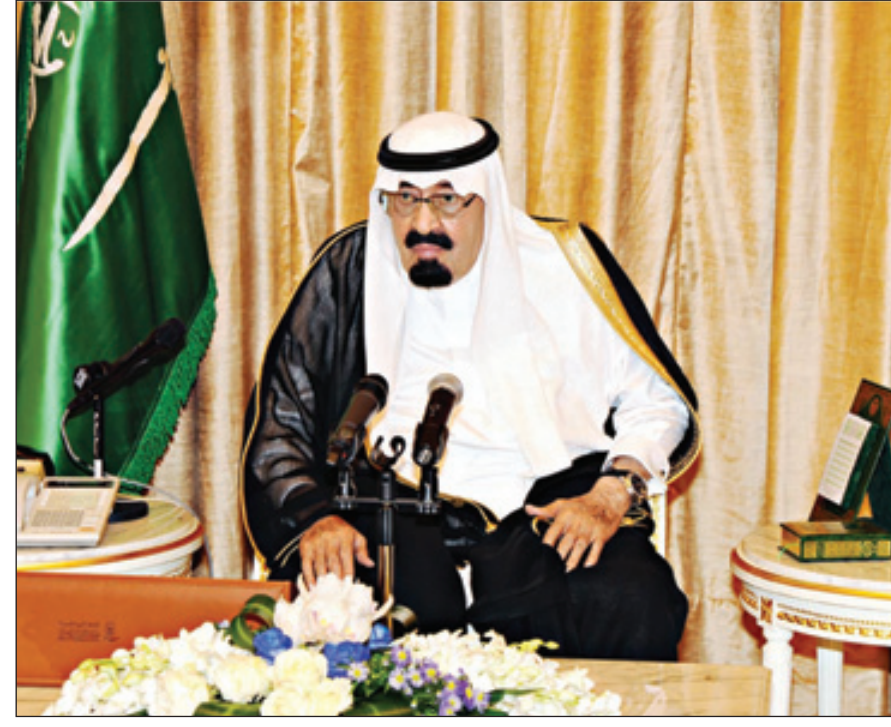
خادم الحرمين خلال الاستقبال

جدد مطالبته الجميع بتحمل المسؤولية وأداء واجب الدين والوطن والشعب