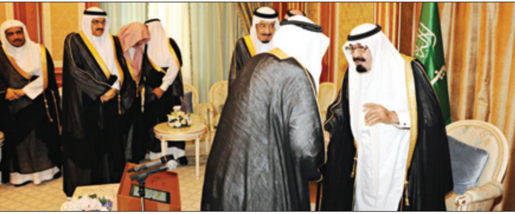
ويدشن المشاريع الجديدة

وزير التعليم العالي مخاطباً الملك: الإنجازات كانت آمالاً وأحلاماً وبدعمكم أضحت حقيقة