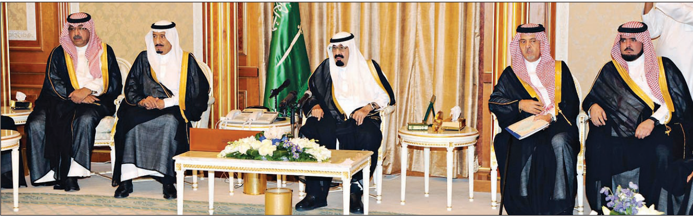
الملك عبدالله خلال الاحتفال ويبدو وزير الدفاع وعدد من أصحاب السمو والوزراء

الحمد لله رب العالمين... ولله الحمد، مالنا إلا الشكر من الصغير والكبير للرب عز وجل، الحمد لله رب العالمين، الله أكرمنا وأعطانا وساعدنا والشكر واجب على كل مسلم ومسلمة وكل من سكن المملكة العربية السعودية والحمد لله رب العالمين ما علمنا إلا الشيء الواجب علينا، وإن شاء الله الأيام المقبلة أي شيء نراه في خدمة ديننا ووطننا ويساعد شعبنا للنهوض بهذا البلد الأمين فما نحن مدخرين أبداً أبداً. وكلكم أطلب منكم أنتم يا إخواني وأحلمكم مسؤولية كبيرة لأنكم اخترناكم من بين شعب المملكة العربية السعودية ولازم تقدرين هذا ولازم تتحملون المسؤولية وتؤدون واجبكم نحو دينكم ووطنكم وشعبكم.