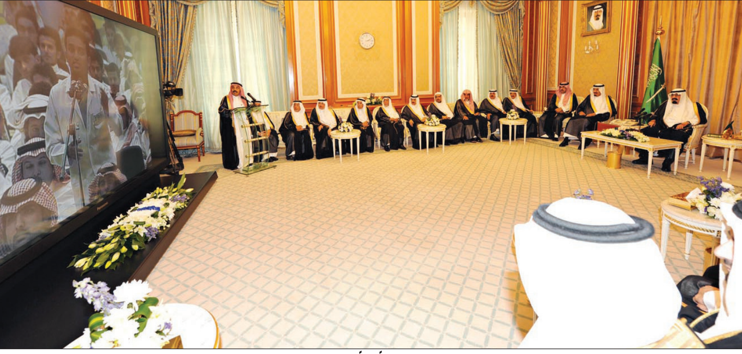
ويشاهد عرضاً مرئياً عن المشاريع