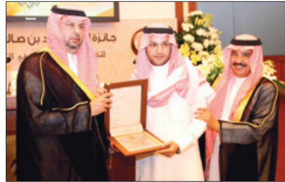
الزميل الغنيم يتسلم درع تكريم «الرياض» من راعي الحفل