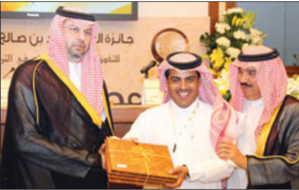
ويكرم اللجان العاملة