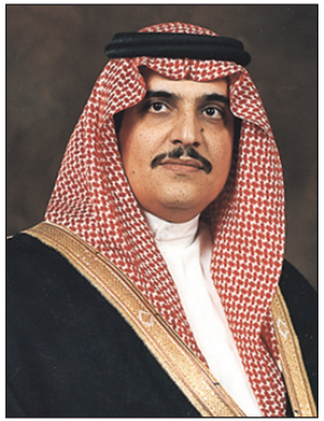
الأمير محمد بن فهد

الدمام - واس قال صاحب السمو الملكي الأمير محمد بن فهد بن عبدالعزيز أمير المنطقة الشرقية « إن الذكرى السابعة لمبايعة خادم الحرمين الشريفين الملك عبدالله بن عبدالعزيز آل سعود في هذا اليوم نذكر سبعة أعوام من العطاء والإنجاز الذي عمت أرجاء الوطن، فعندما نستذكر هذه الإنجازات ونريد حصرها فإن اللسان يعجز عن ذكرها لأنها فاقت خيال الوطن والمواطن. إن عهد خادم الحرمين الشريفين شهد القرارات التي أسهمت في تحقيق الراحة والرفاهية للمواطن السعودي وتحقق النماء والتطور للوطن ليرتقي ويصبح في مصاف الدول المتقدمة، فقد استطاع - حفظه الله - بحكمته وفائق بصيرته أن يجعل هذا الوطن موطن الأمن والاستقرار والوحدة الوطنية التي لم يشهدها أي موطن في عالمنا الذي يعيش من حولنا حيث جعل أمن الوطن والمواطن جل