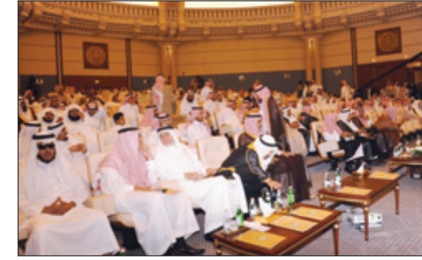
جانب من حضور الحفل الختامي