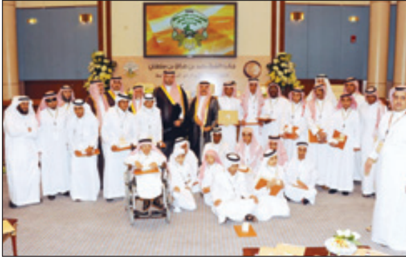
الفائزين في لعملة تذكارية مع راعي الحفل والشيخ سلطان