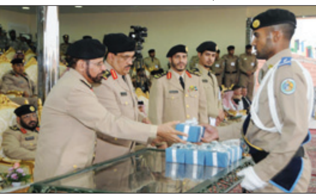
الفريق الركن السواط خلال التكريم

الرياض - صالح الحميدي أكد مدير عام حرس الحدود الفريق الركن زعيم بن جويبر السواط استمرار حرس الحدود في خطته الرامية لتطوير قدراته وإمكاناته في اطار توجيهات ودعم صاحب السمو الملكي الأمير نايف بن عبدالعزيز ولي العهد نائب رئيس مجلس الوزراء وزير الداخلية وسمو نائبه وسمو مساعده للشؤون الامنية وقال ان حرس الحدود هو الخط الاول لحماية البلاد.