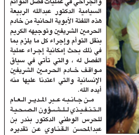
وزير الصحة مطمئنا على السيامي مع الفريق الطبي

مبيناً معاليه أن هناك حاجة لإجراء مزيد من الفحوصات الطبية الدقيقة خلال الثلاثة اسابيع المقبلة للتأكد من عقم الانتصاق.