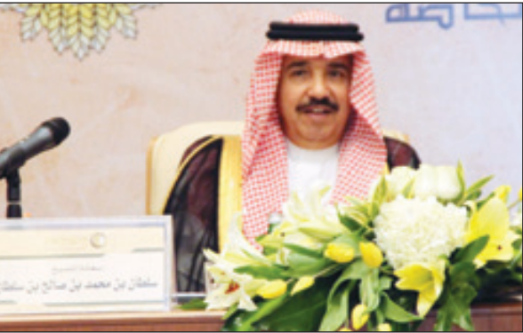
الشيخ سلطان بن محمد يقلي كلمة