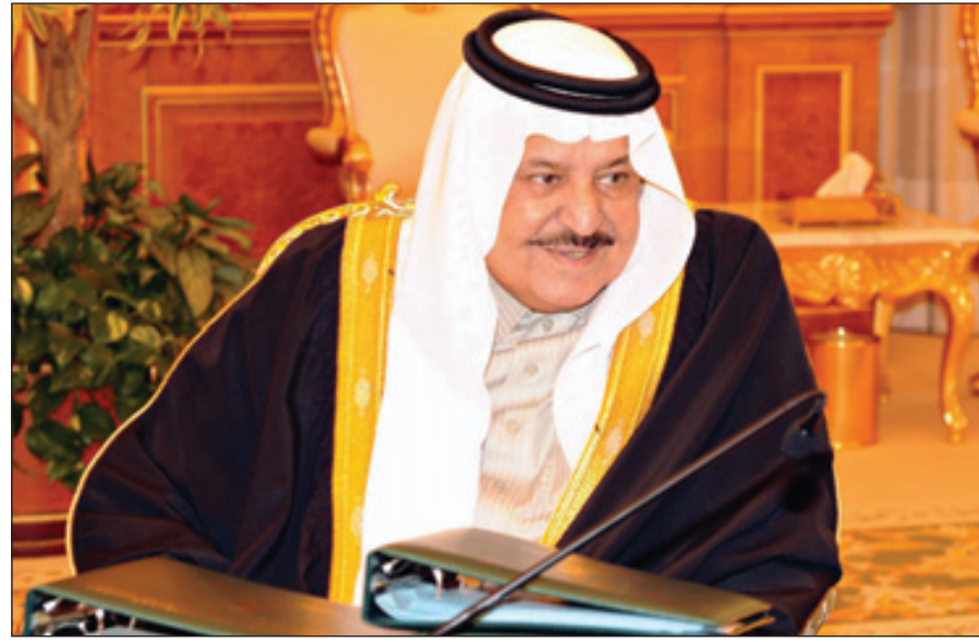
الأمير نايف خلال حضوره الجلسة

أولاً: إضافة معالي وزير الثقافة والإعلام إلى عضوية مجلس إدارة