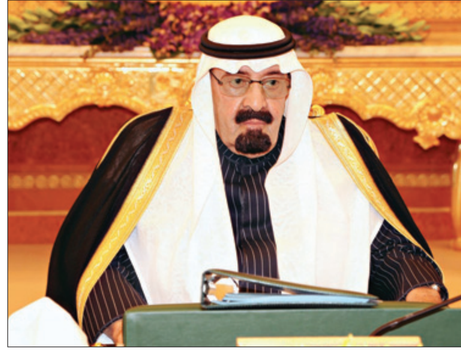
الملك عبدالله خلال ترؤسه الجلسة

المملكة ترحب بدعوة تونس لاستضافة مؤتمر «أصدقاء سورية»