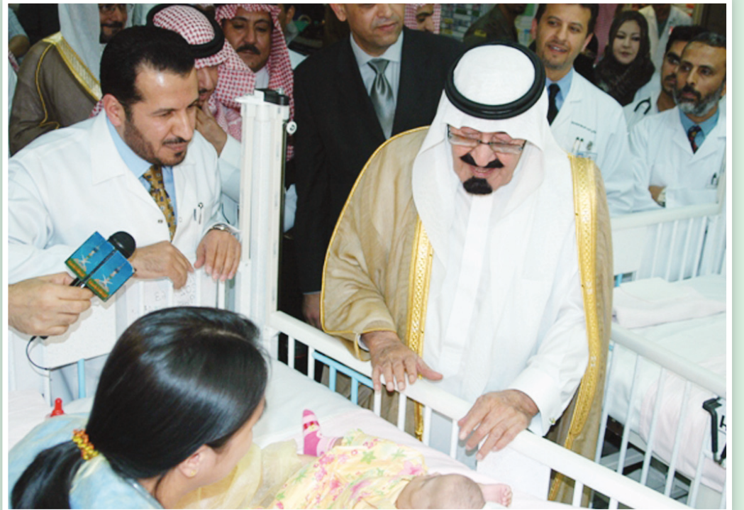
خادم الحرمين خلال زيارته للطفلتين داريا واولغا بعد عملية فصلهما بالرياض

وصف موقف خادم الحرمين تجاه التوأّم البولنديتين بالنسبة لرئيس وزراء بولندا: كن ننسى موقف ملك الإنسانية الرياض - محمد الحيدري ■ وصف دولة رئيس وزراء بولندا دونالد تسك موقف خادم الحرمين الشريفين الملك عبدالله بن عبدالعزيز "حفظه الله" تجاه الطفلتين السياميتين البولنديتين داريا واولغا بأنه موقف نبيل لن ينساه الشعب البولندي الملك الإنسانية. جاء ذلك خلال لقائه أمس بوزير الصحة الدكتور عبدالله الربيعية في إطار زيارته الرسمية التي يقوم بها للمملكة. وقال تسك: بان مبادرة الملك عبدالله نحو الطفلتين داريا واولغا كان لها أثر كبير ومرودو إيجابي في العلاقة بين بولندا والمملكة، وعمل الملك عبدالله الإنساني هذا ساهم وسيساهم بشكل كبير في توطيد العلاقات بين الشعبين الصديقين. يذكر أن عملية فصل سياميتي بولندا تمت بمدينة الملك عبدالعزيز الطبية بالحرس الوطني بالرياض بقيادة وزير الصحة الدكتور عبدالله الربيعية الذي ترأس وقاد الفريق الطبي والجراحي في عملية فصلهما الماراثونية التي استمرت أكثر من ١٥ ساعة في شهر يناير من العام ٢٠٠٥ م.