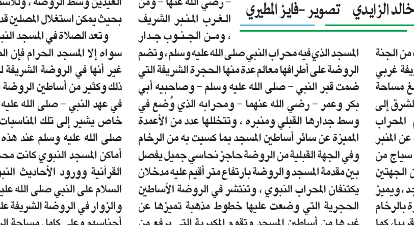
ازحام الروضة الشريفة بالحجاج