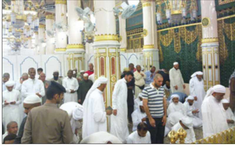
منظر عام للروضة الشريفة