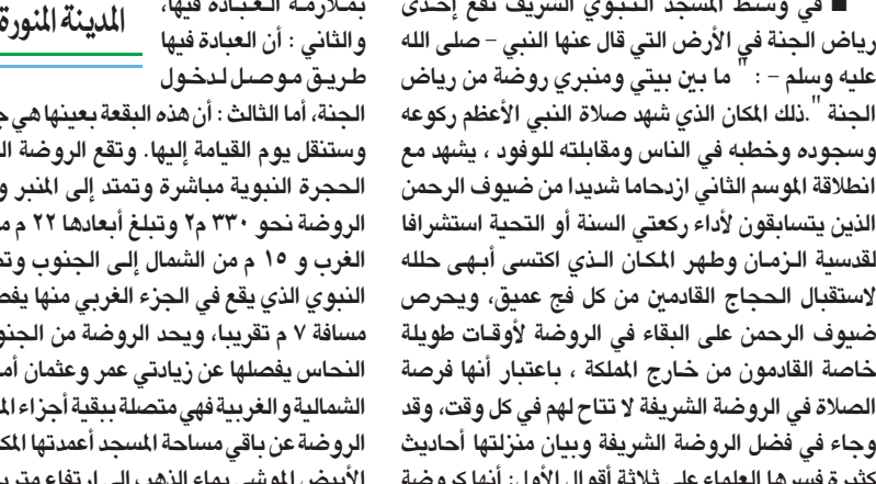
منظر عام للروضة الشريفة