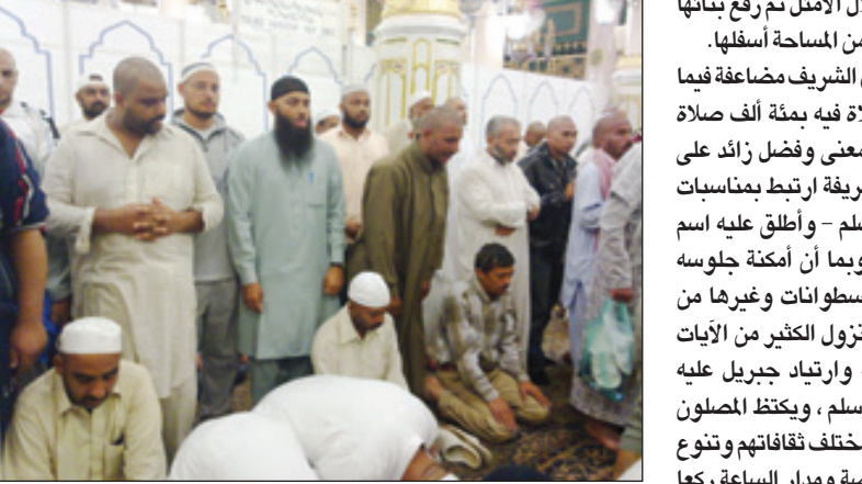
حاجج يتوسط الروضة حرصا على تمكين النساء من الزيارة