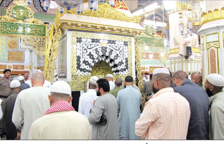
الحرس على تأدية الصلاة في محراب النبي صلى الله عليه وسلم

الرياض-واس ■ أدى صاحب السمو الملكي الأمير محمد بن سعد بن عبدالعزيز أمير منطقة الرياض بالنيابة بعد صلاة العصر أمس صلاة الميت على الفقيد صاحب السمو الأمير عبدالله بن عبدالعزيز بن سعود بن جلوي - رحمه الله - بجامع الإمام تركي بن عبدالله بالرياض. وقد أدى الصلاة مع سموه صاحب السمو الأمير محمد بن عبدالله بن جلوي، وصاحب السمو الملكي الأمير فهد بن محمد بن عبدالعزيز، ومساعد، وصخر.