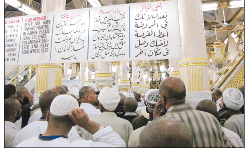
ازحام الروضة الشريفة بالحجاج