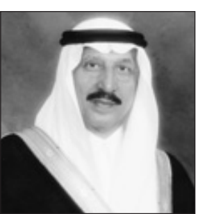
الأمير محمد بن ناصر بن عبدالعزيز

ونوه سمو أمير منطقة الحدود الشمالية بما قام به خادم الحرمين الشريفين خلال السنوات الماضية لتوفير سبل الحياة