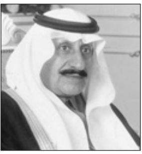
الأمير عبدالله بن عبدالعزيز بن مساعد

الملك عبدالعزيز -رحمه الله- ومن ثمّ سار أنباؤه البررة على ربه من بعده حتى تسلم خادم الحرمين الشريفين الملك عبدالله بن عبدالعزيز آل سعود - حفظه الله - زمام الحكم في هذه البلاد المباركة التي شهدت في عهده الميمون نقله حضارية في شتى مجالات الحياة، وحبها المولى نعماً كثيرة وفي مقدمتها نعمة الأمن التي ينعم بها المواطن والمقيم، مبرزاً سموه ما توافر للمواطن من مرافق وخدمات صحية وتربوية وصناعية