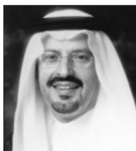
الأمير سعود بن عبد المحسن بن عبد العزيز