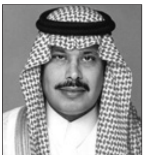
الأمير مشاري بن سعود

أكد صاحب السمو الملكي الأمير مشاري بن سعود بن عبدالعزيز أمير منطقة الباحة أن اليوم الوطني للمملكة من الأيام المجيدة في التاريخ المعاصر عاداً الملك المؤسس عبدالعزيز بن عبدالرحمن آل سعود . رحمه الله . واحداً من رموز التاريخ الذي ستمثل نكرهه محفوظة في الأذهان وفي سجلات العطاء الإنساني. جاء ذلك في كلمة لسموه بمناسبة الذكرى الثانية والستين لليوم الوطني للمملكة العربية السعودية، فيما يلي نصها : حين نحل الذكرى السنوية ليوم الوطني لبلادنا التي تصادف اليوم الأحد ١٤٢٣/١١/٧ فإنه بقراءة سريعة للإنجازات نسبية إلى عمر الزمن فإن الإنسان يسرع في جليا أن تلك المشروع الحضاري الكبير الذي أسس قواعده الملك عبدالعزيز طيب الله ثراه لم يكن مصادفة أو حدثاً عابراً في دورة التاريخ إنما مشروعا عموماً له من الرؤية والبعث الحضاري ما نتج عنه مولد هذا الكيان الكبير الذي يسابق الزمن علواً ويتجاوز كثيرا من الحضارات والقاعدة منذ القدم بعد أن أدرك موعدة الملك عبدالعزيز - طيب الله ثراه - بأنه لا يمكن لأي نهضة أن تقوم بخطى وثيقة وراسخة ما لم تكن على هدى من كتاب الله وتوجيهه جل جلاله فلذلك كان من أهم أولويات توحيد شتات الجزيرة هي توحيد الناس على عبادة الواحد الديان وتجديد دعوة المصطفى صلوات الله وسلامه عليه . وكانت نظرة الملك