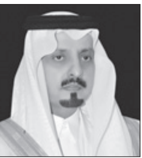
الأمير فيصل بن خالد

جهد وكل عمل يفضي إلى إضافة لبنة أخرى في هذا البناء الشامخ الذي شكل نمونجاً يحتذى للإنسان العربي في عالم يعج بالاضطرابات والتناقضات، ووقفة التأمّل هي تأكيد على مفهوم ومضمون هذا الرمز ومواجهة هذا العالم بخطى وثيقة تشق طريقها إلى المستقبل مرتكزة وتنهيات للمستقبل. وتطلعنا واعدة وإثقة. وقال حسي بكل أسأل الله ان يديم على بلادنا نعمة الامن والامان والاستقرار والرخاء وان يحفظ سيدي خادم الحرمين الشريفين الملك عبدالله بن عبدالعزيز وسيدي نائب خادم الحرمين الشريفين صاحب السمو الملكي الأمير سلمان بن عبدالعزيز وصاحب السمو الملكي الأمير أحمد بن عبدالعزيز وزير الداخلية وان تستمر مسيرته البناء والنماء والعتاء انه سميع مجيب الدعاء.