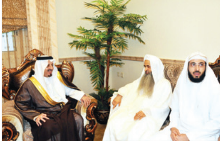
الامير فيصل بن خالد معايدا الشيخ الحواشي بمنزله