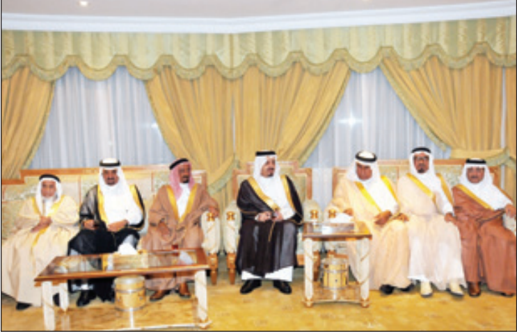
الامير فيصل بن خالد وعلى يساره الشيخ عبدالعزيز بن مشيط