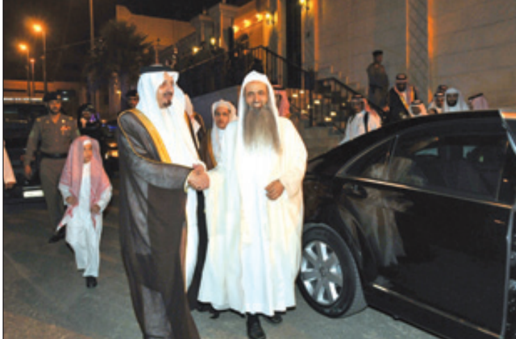
الشيخ الحواشي ومودعا الامير فيصل بن خالد

والسلوان، مؤكدا سموه بان الفقيد خدم المنطقة، وكان مشهودا له بخلقه الرفيع . من جهته قدم نوو المتوفى شمس أول أيام عيد الفطر المبارك. ودعا الأمير فيصل بن خالد، الله أن يرحم المتوفى وأن يجبر مصاب ذويه وأن يلهمهم الصبر