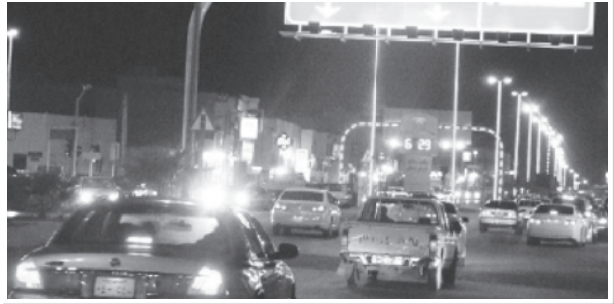
أنوار الزينة تملأ شوارع ساجر