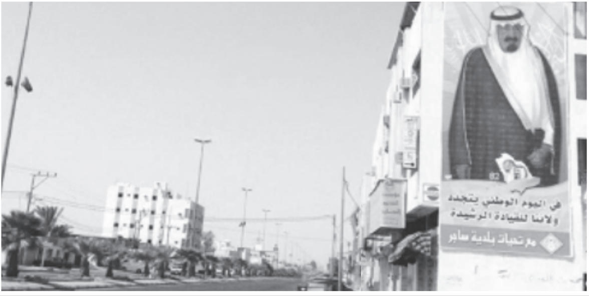
أحد الشعارات بالميادين العامة